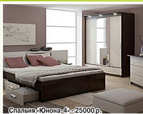
Спальня «Юнона-4» - 25000р.