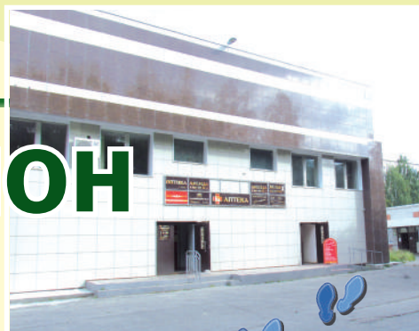
Здание Центральной аптеки (вход справа)

Мебель российских производителей. Владимир, Пенза, Н. Новгород, Москва.