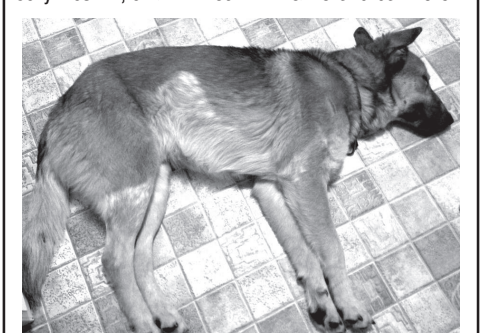
Очень устал на улице . Спит.

НАЙДЕНА СОБАКА . Ухоженная!! С ошейником и карабином на нем. Очень добрая. Выполняет все команды. Бегаёт за всеми темными машинами, ищет своего хозяина. В данный момент находится у меня дома. Держать долго не могу, так как уезжаю на работу. Хозяин, откликнитесь!!!!!! Тел. 8-910-092-25-37.