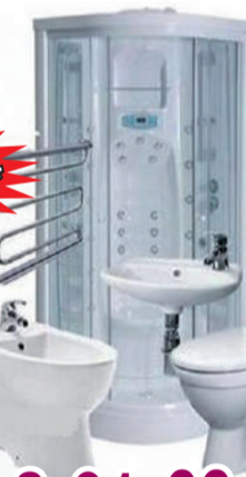
*Подробности в магазине

Часы работы: с 9.00 до 19.00, ежедневно, без выходных.