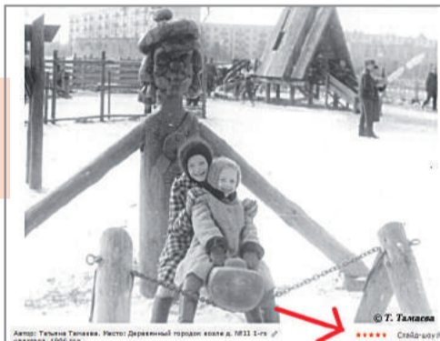
Автор: Татьяна Таласова. Место: Деревенский городок возле д. №31 1-й кв. Радужный, 1966 год.

Итоги фотоконкурса будут опубликованы в СМИ и на официальном сайте города (raduzhnyi-city.ru).