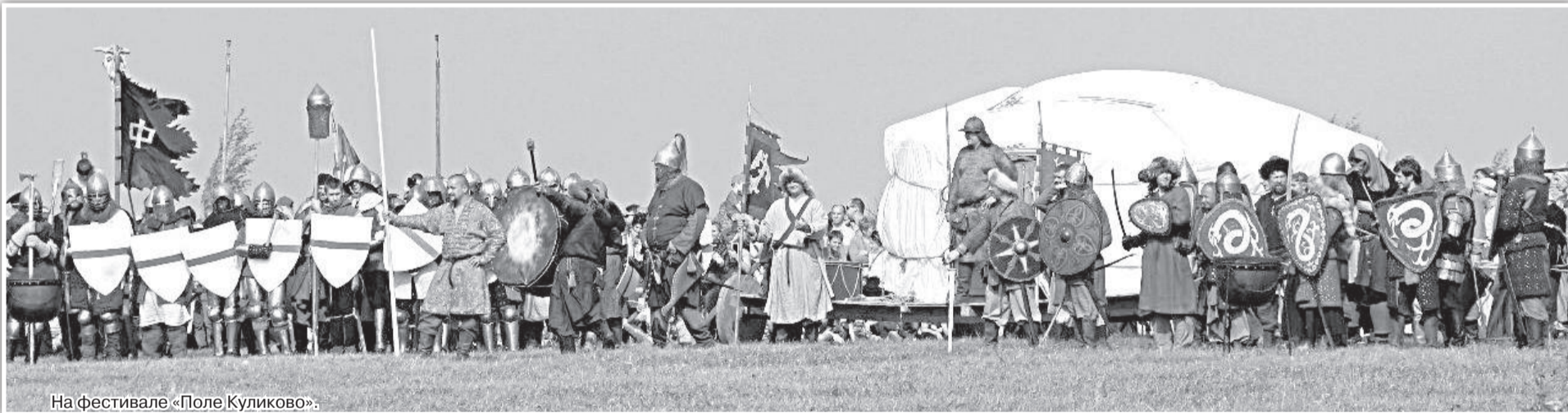
На фестивале «Поле Куликово».

О. Максимова. Фото предоставлено автором.