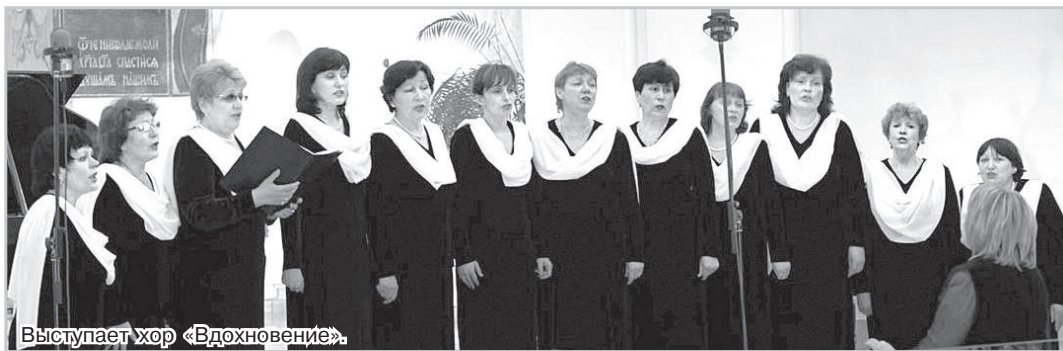
Выступает хор «Вдохновение».

Под сводами знаменитого Георгиевского собора с его уди-