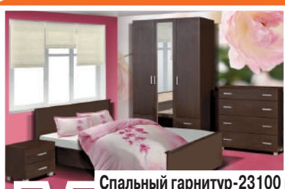
Спальный гарнитур-23100 р.

Пн.-пт.: 10.00-19.00, сб., вс.: 10.00-16.00