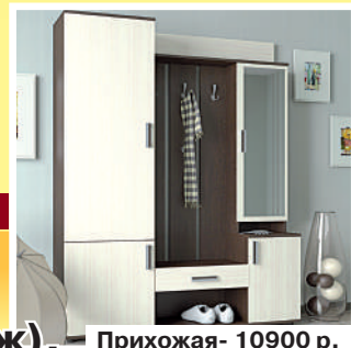
Прихожая- 10900 р.

ДЕЙСТВУЕТ РАССРОЧКА 3 МЕСЯЦА, БЕЗ БАНКА, БЕЗ КОМИССИЙ.