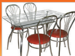
Обеденная группа. Стол-7600 р., стулья-1120 р.