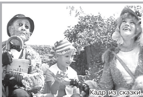
Кадр из сказки.