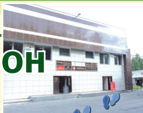
Здание Центральной аптеки (вход справа)