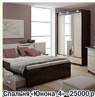
Спальня «Юнона-4» - 25000р.