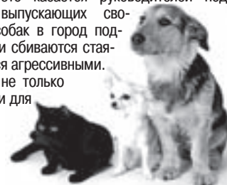
Объединение «Верный друг».

Особенно это касается руководителей подразделений, выпускающих своих охранных собак в город подкармливать. Они сбиваются стаями и становятся агрессивными. И это опасно не только для кошек, но и для нас, людей.