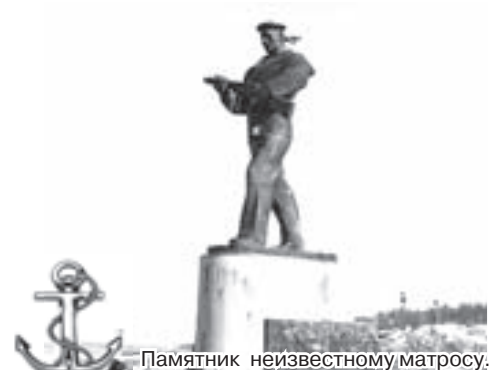
Памятник неизвестному матросу.