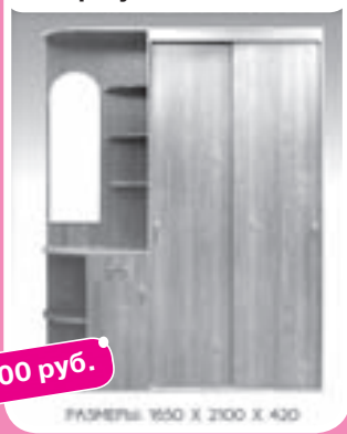
Шкаф-купе «Наташа №1»