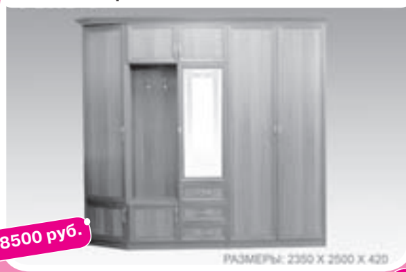
Прихожая «Теко 7»