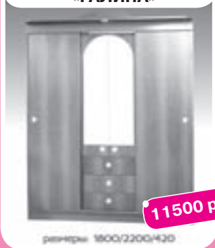
Шкаф для прихожей «ГАЛИНА»