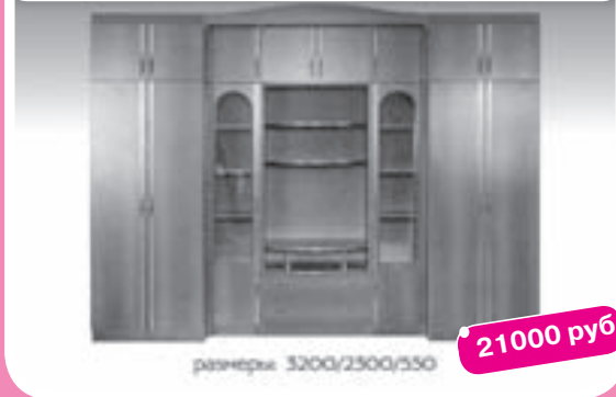
Стенка «Олимп -4»