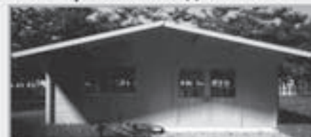
Садовый дом с навесом, 6000x6000 380 000 руб.

Фундамент - винтовые сваи - ВКЛЮЧЕНО В СТОИМОСТЬ - Внешняя и внутренняя отделка и покраска