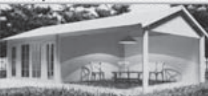
Садовый дом с верандой, 3800x3800+3800 242 500 руб.