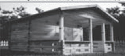
Баня с верандой, 4200x2300+2000 319 000 руб.

Мы строим из экологически безопасных материалов по современным технологиям теплые дома из клееного бруса, садовые дома с навесами и верандами, каркасные дома, беседки, бани, различные хозяйственные постройки «под ключ».