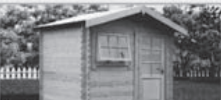
Хозяйственная постройка, 2500x2000 76 000 руб.