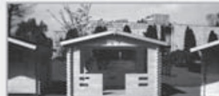
Открытая беседка, 3000x3000 85 000 руб.

Мы строим из экологически безопасных материалов по современным технологиям теплые дома из клееного бруса, садовые дома с навесами и верандами, каркасные дома, беседки, бани, различные хозяйственные постройки «под ключ».