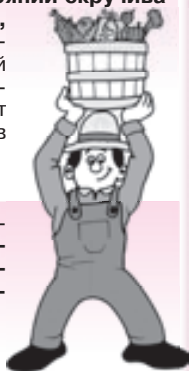
По материалам из открытых источников.

9. В течение всей работы на грядках приостанавливайтесь примерно через каждые 15 минут, чтобы вовремя передохнуть.