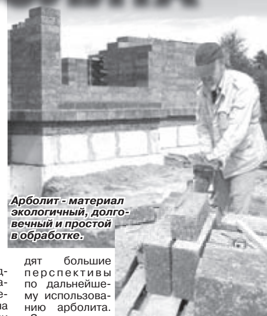
Арболит - материал экологичный, долговечный и простой в обработке.

Многие жители Владимирской области успели по достоинству оценить данный строительный материал. В компании «ЮТА» ви-