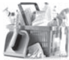
По материалам из открытых источников.

• Микроволновая печь требует особой осторожности в выборе средств для чистки, так как её внутреннюю поверхность ни в коем случае нельзя повредить. Мыть микроволновку можно только мыльными растворами и мягкими тканями. Пригоревшие остатки и брызги (актуально для печей с грилем) легко удаляются, если перед тем, как мыть, вскипятить в ней чашку воды с добавлением лимонного сока и дать жидкости немного испариться. Чтобы избавиться от неприятных запахов в микроволновке, можно использовать водный раствор столового уксуса (1:3). Если протереть им внутреннюю поверхность и оставить дверцу печи на полчаса открытой, запахи исчезнут.