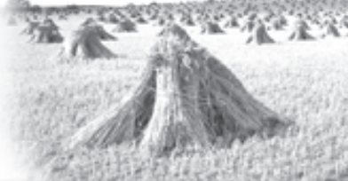
По материалам из открытых источников.

С Ильина дня начинаются утренники. «Муха до Ильина дня кусается, а после - запасается». «После Ильина дня комары перестают кусаться».